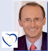
Othmar Karas * 1957, Ybbs Wirtschaft, Währung, Rechtsfragen, Binnen- markt, Verbraucher- schutz www.othmar-karas.at