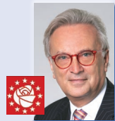
Hannes Swoboda * 1946, Bad Deutsch Altenburg Außenpolitik, Industrie, Forschung, Energie, Sicherheit, Verteidigung www.hannes-swoboda.at