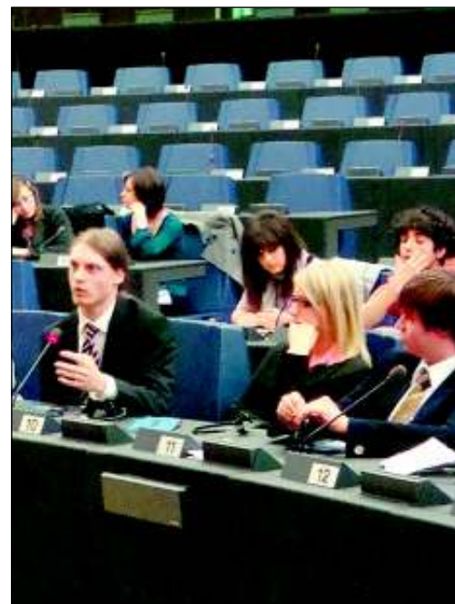
In den Gruppen wurde viel diskutiert.