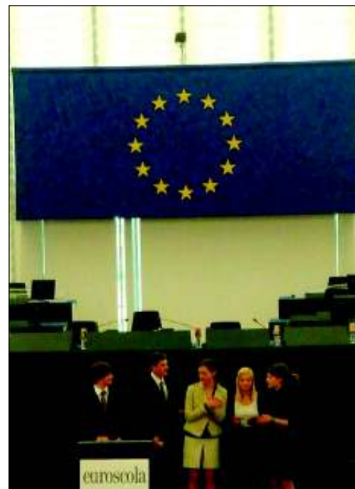
Die Steyrer Vorträge kamen gut an.

Nach zehn Stunden im Allerheiligsten der EU zeigen sich die Steyrer Schüler zwar müde aber dennoch begeistert. „Wir können jedem, der die Möglichkeit hat bei Euroscola teilzunehmen, nur raten mitzumachen.“