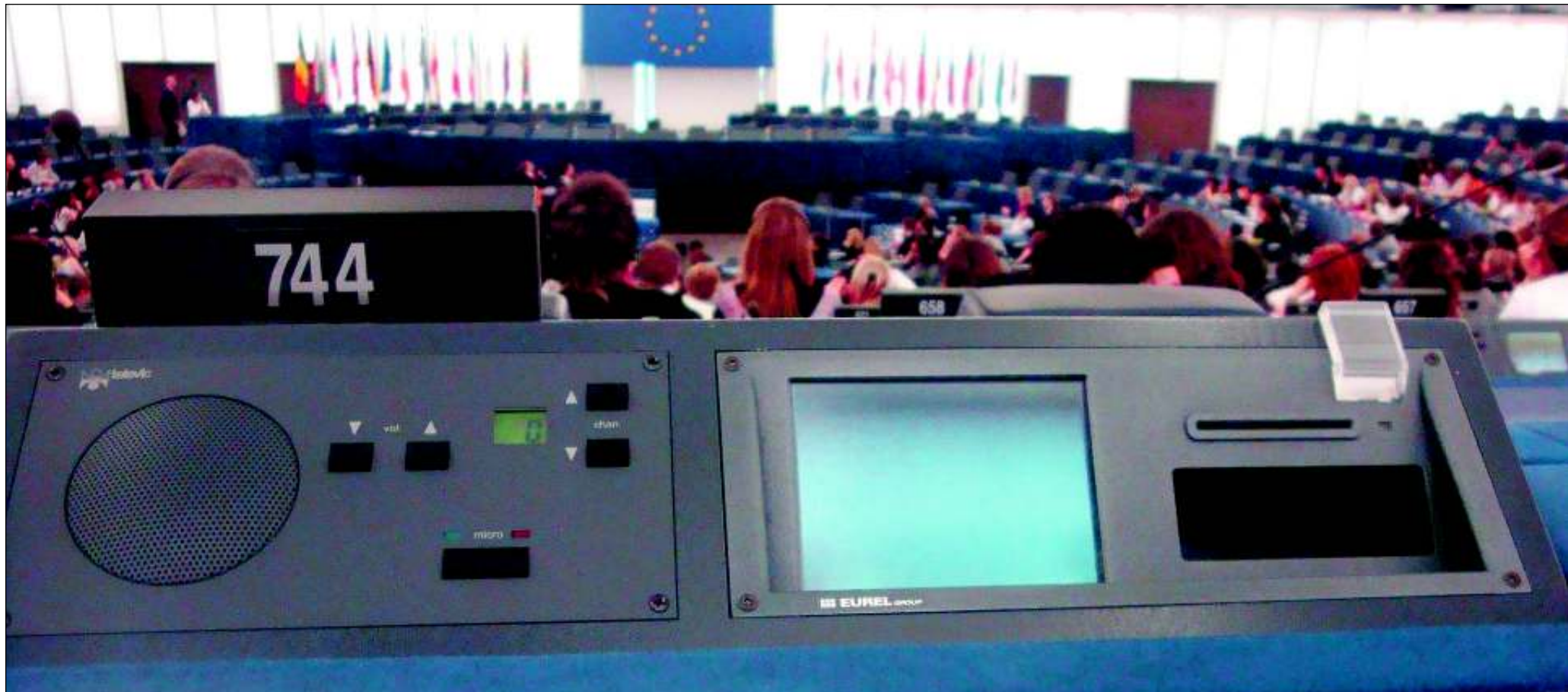
Mit Hilfe einer Konsole können die Abgeordneten (in diesem Fall die Schüler) über Anträge abstimmen.

Ihr Wetter im Internet auf nachrichten.at/wetter