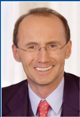
Othmar Karas Leiter der ÖVP Delegation