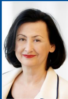
Maria Berger Leiterin der SPÖ Delegation